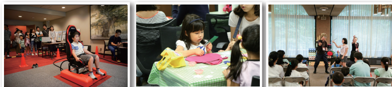
第1回防災推進国民大会より