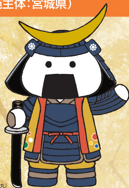
仙台・宮城観光 PRキャラクター「むすび丸」

県内における障害者の雇用状況は、未だ多くの障害者の方が働く場を求めており、依然として厳しい状況となっております。また、県内民間企業の障害者雇用率は、平成27年6月1日現在で、1.79%と法定雇用率(2.0%)を下回り、全国平均(1.88%)にも達していない状況でありますことから、本県における障害者雇用の更なる推進が求められています。こうした状況を踏まえ、宮城県では、就職を希望する障害者が一人でも多く就職し、さらに就職した企業に定着できるように、今年度も10月から「障害者雇用アシスト事業」を実施しています。なお、本事業については、宮城県からの受託事業者として株式会社チャレンジドジャパンとアデコ株式会社が実施・運営いたします。