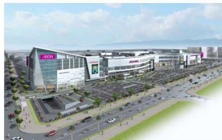
イオンモールビンタンのパース

ベトナム進出に関心のある県内事業者の皆さまのご参加をお待ちしておりますので、ふるってご応募ください。