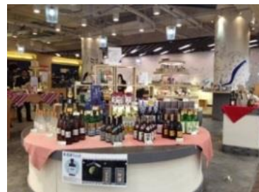
<上海のアンテナショップ>