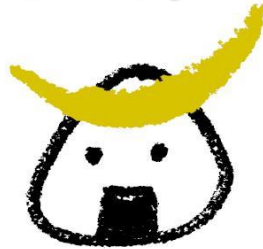
仙台・宮城観光PRキャラクター むすび丸

主催：宮城県、宮城労働局、 ハローワーク仙台・石巻・大崎 宮城就業支援ネットワーク