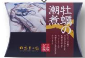
H24モニタリング調査実施商品 結果：パッケージ・デザインを変更