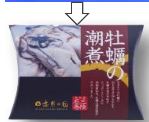
H24モニタリング調査実施商品 結果：パッケージ・デザインを変更