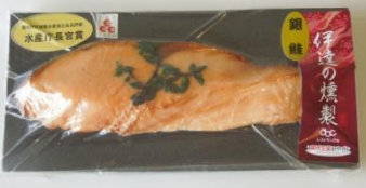
H24モニタリング調査実施商品 結果：製造方法の一部を再検討中